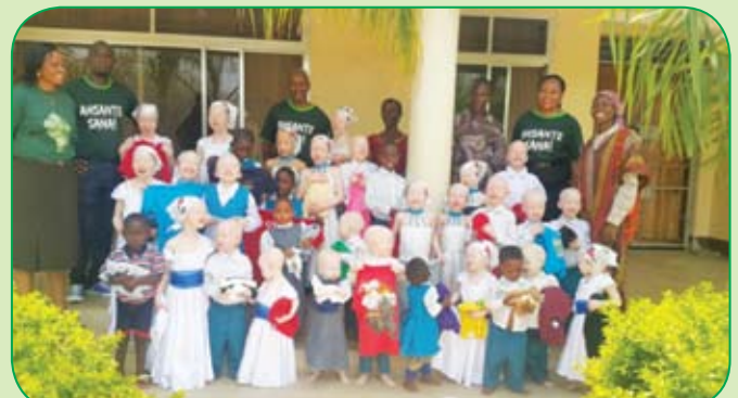
Wafanyakazi wa Benki Tawi la Nyerere, Jijini Mwanza walipotembelea kituo cha afya cha Mama wa Mungu