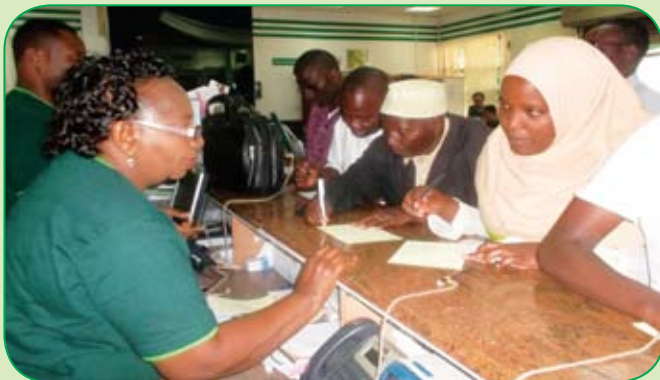
Mmojawapo wa Wafanyakazi wa Benki akihudumia wateja katika Wiki ya Huduma kwa Wateja. Wiki ya Huduma kwa Wateja hutumika pia kupokea maoni mbalimbali kutoka kwa wateja.