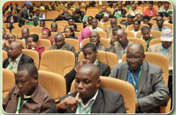
Pichani: Wanahisa wa Benki ya CRDB wakisikiliza kwa makini mada mbalimbali zilizowasilishwa katika Mkutano Mkuu wa Ishirini uliofanyika tarehe 9, Mei 2015 Jijini Arusha.