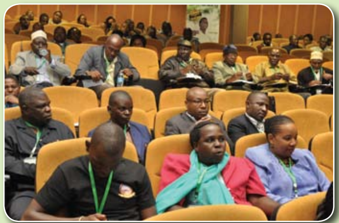
Pichani: Wanahisa wakifuatilia mada zilizowasilishwa kwenye Semina ya wanahisa iliyofanyika tarehe 8 Mei, 2015 siku moja kabla ya Mkutano Mkuu. Mada hizo zilikuwa ni "Ukuzaji wa Mitaji kwa Kampuni zilizoorodheshwa katika soko la hisa" na "Fursa zitokanazo na Huduma ya uwakala wa Benki ya CRDB".