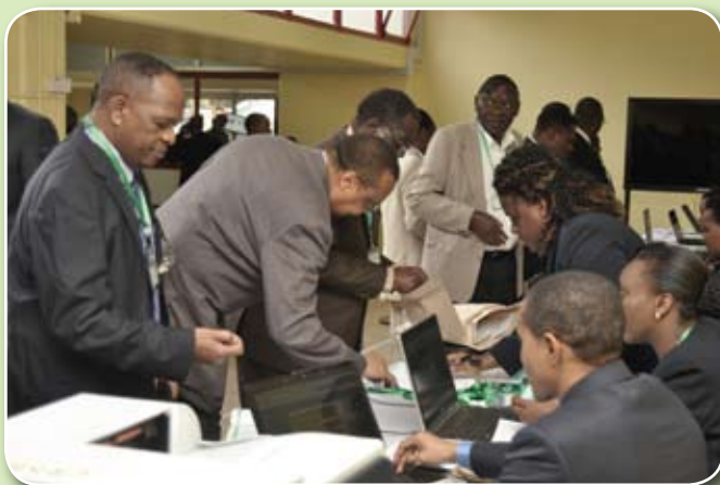
Pichani: Baadhi ya wanahisa, viongozi pamoja na baadhi ya wafanyakazi wa Benki wakijisajili tayari kuanza Mkutano Mkuu wa Ishirini siku ya Jumamosi tarehe 9 Mei, 2015.