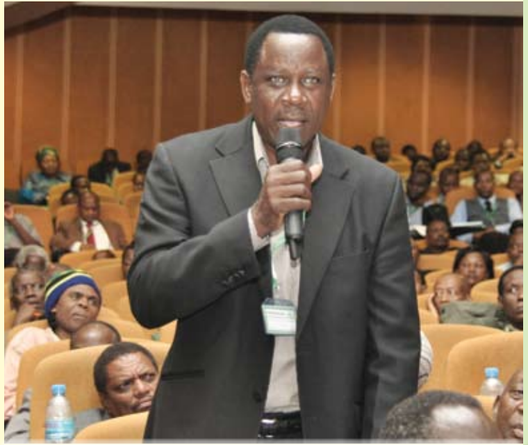
Mwanabisa akitoa maoni na kuuliza swali kwenye Mkutano Mkuu wa Ishirini wa Benki uliofanyika hivi karibuni Jijini Arusha.

Mkutano wa mwaka huu ulifana sana kwani ulihudhuriwa na wanahisa wengi ambao idadi yao ilikuwa zaidi ya elfu moja, waliowakilisha asilimia 75.6 ya hisa zote. Wanahisa hawa, walitoka sehemu mbalimbali za taifa letu na walikuwa wamejaa hamasa kubwa katika kutoa michango, mawazo na kuuliza maswali yaliyolenga kuboresha utendaji wa Benki na kuifanya iendelee kuongoza katika utoaji wa huduma bora za kifedha hapa nchini.