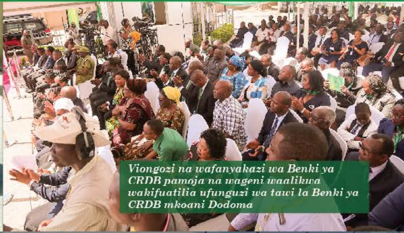
Viongozi na wafanyakazi wa Benki ya CRDB pamoja na wageni waalikwa wakifuatilia ufunguzi wa tawi la Benki ya CRDB mkoani Dodoma