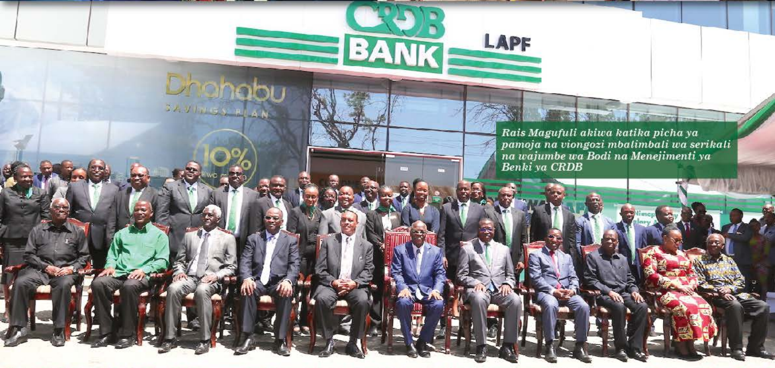
Rais Magufuli akiwa katika picha pamoja na viongozi mbalimbali wa serikali na wajumbe wa Bodi na Menejimenti ya Benki ya CRDB